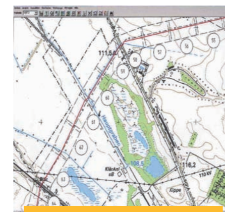
Grün dargestellt: die ermittelte Fläche. Rot: die querende Hochdruckleitung

Um solche Gefahren aufzuspüren, ist der erste Schritt eine umfassende Recherche zu bergbaulichen Aktivitäten im Bereich vorhandener Anlagen. Die so erkundeten Flächen werden kartografisch erfasst und in die vorhandenen Leitungspläne übernommen.