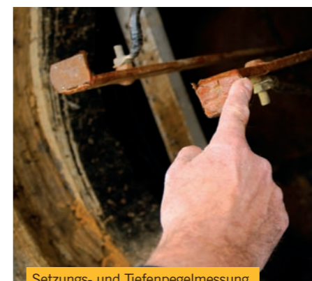
Setzungs- und Tiefenpegelmessung