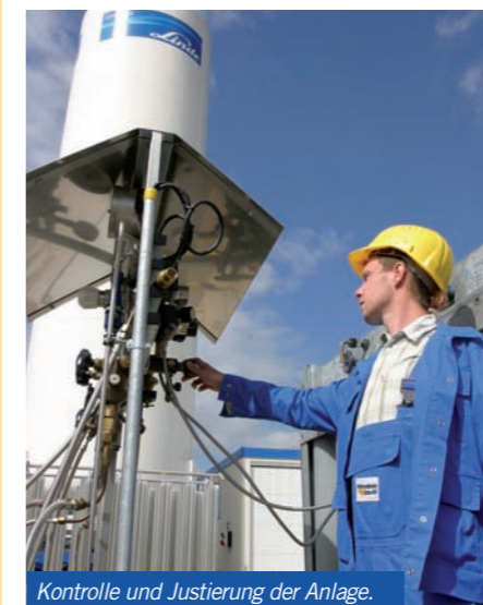
Kontrolle und Justierung der Anlage.

die Möglichkeit, das Verhalten von CO 2 im Untergrund unter realistischen Bedingungen zu untersuchen. Insgesamt rechnet man mit