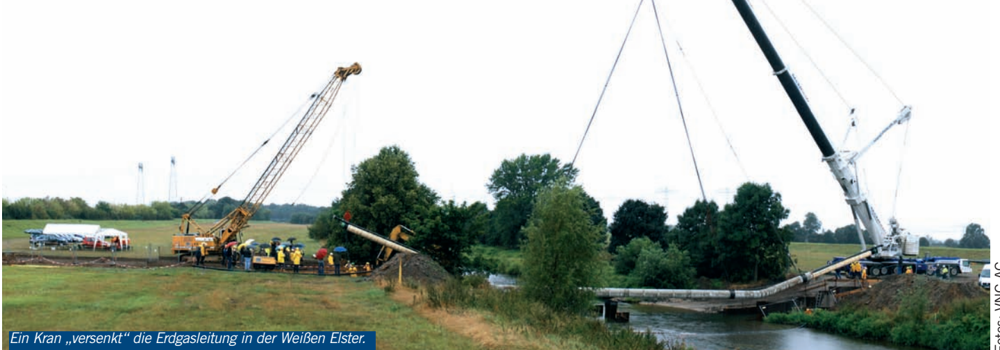
Ein Kran „versenkt“ die Erdgasleitung in der Weißen Elster.

1,2 Mio. € investierte die Ontras in die Sanierung dieses neuralgischen Punktes und trägt damit wesentlich zur Sicherung der Verfügbarkeit dieses Trassenabschnittes bei.