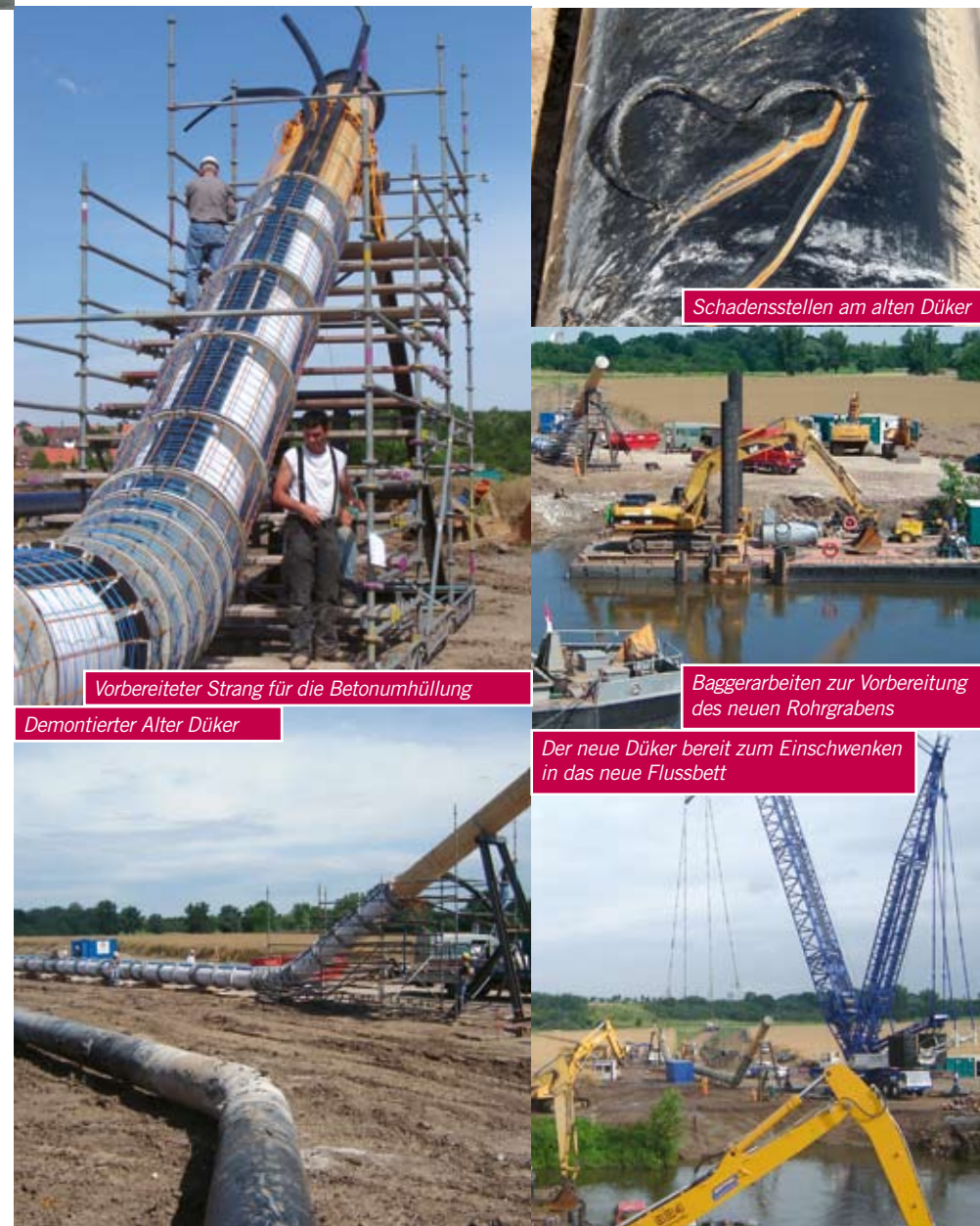
Schadensstellen am alten Düker

Unmittelbar anschließend begannen die Montageleistungen zum Einbinden des neuen Teilstückes in die vorhandene Ferngasleitung.